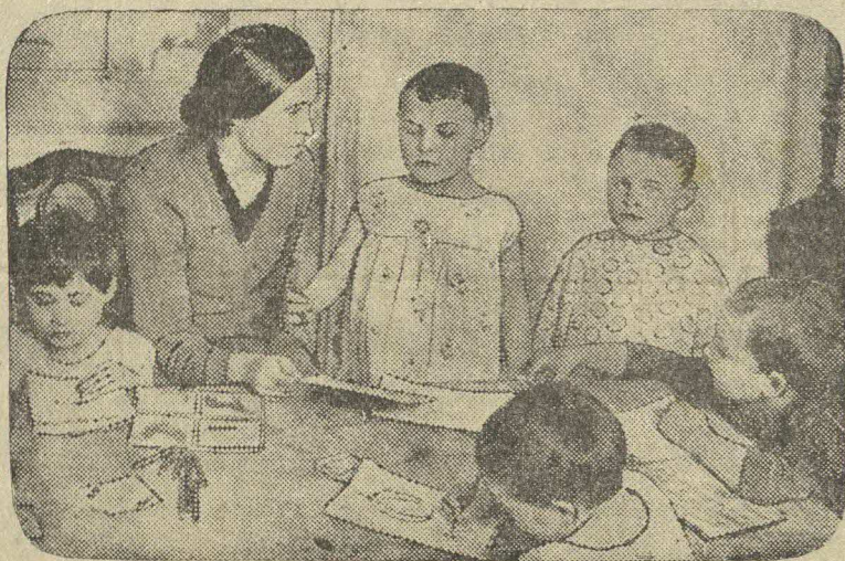
К началу полевых работ в колхозе „Амо“ Н. Аннинского района, Сталинградского края, открыты новые детские ясли на 45 детей. К сожалению, немногие ясли наших колхозов могут похвастаться таким же образцовым порядком.